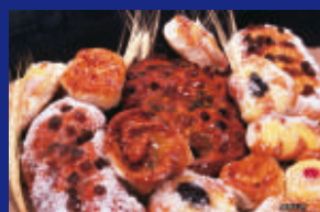
21 - ROSCAS DOCES