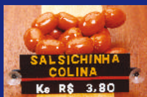
Modelo com Ventosas para fixação em Vidros