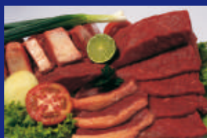
01 - CARNES