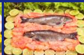
15 - PEIXES