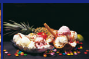
03 - SORVETES