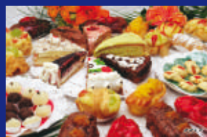
11 - DOCES