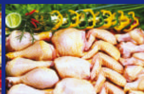
12 - FRANGO