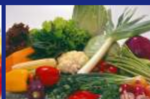
08 - VERDURAS