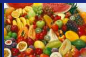
04 - FRUTAS