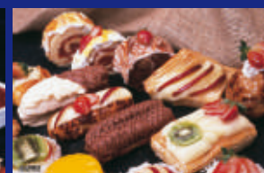
20 - DOCES