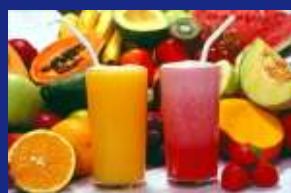
06 - SUCOS