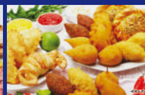
10 - SALGADOS