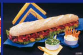
18 - SANDUICHE