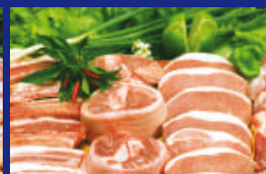
13 - CARNE SUINA