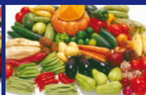
07 - LEGUMES