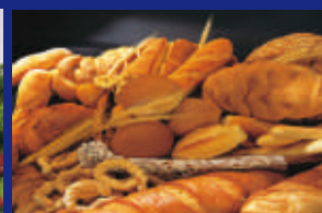
02 - PÃES