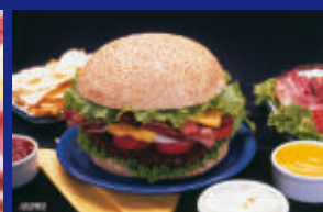
17 - LANCHE