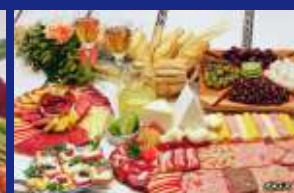
09 - FRIOS