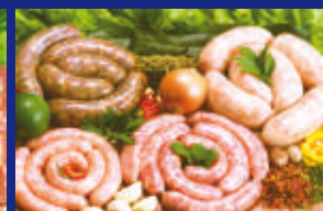
14 - LINGUIÇAS