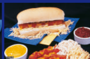
19 - HOT DOG