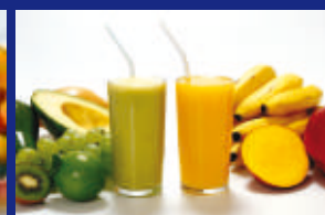
05 - VITAMINAS