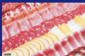
16 - FRIOS